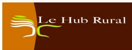
Plate Forme d'Appui au Développement rural et à la Sécurité Alimentaire en Afrique de l'Ouest et du Centre

Sacré-Cœur III Extension Villa n°10406 BP 5118 - Tel +221 33 869 96 40 - Fax +221 33 869 81 75 - Site : www.hubrural.org