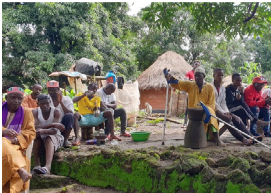
L'ancien village de Hamdallaye s'est situé parmi la végétation luxuriante