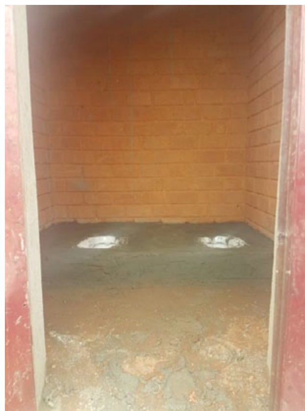
Les toilettes manquent d’intimité et sont mal construites.

D’après les familles de Hamdallaye, la qualité des logements est médiocre et les infrastructures sur le site sont inadéquates, notamment en ce qui concerne l’eau et l’assainissement. Les toilettes sont mal construites en raison de la faible profondeur des fosses des latrines, ce qui a entraîné des odeurs nauséabondes, des colmatages et des conditions insalubres. CBG a construit six forages équipés de pompes à motricité humaine sur le site de réinstallation, mais les résidents signalent des problèmes d’approvisionnement, qui peut être dû à une insuffisance d’eau souterraine. Le faible approvisionnement en eau a signifié que les femmes, qui sont généralement responsables de la collecte de l’eau à domicile, ont dû attendre dans de longues files d’attente aux forages près de la mosquée et du