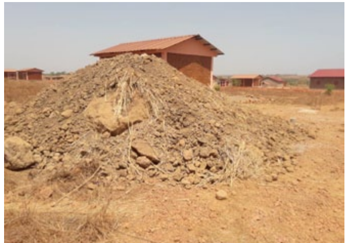
Le nouveau site de réinstallation de Hamdallaye qui manque la terre noire