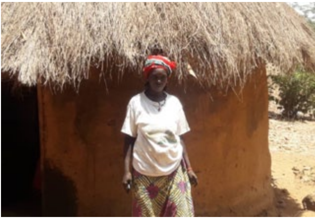
Veuve avec sept enfants sans logement de remplacement

le recasement et la restauration des moyens de subsistance”. (Section 8.6.1).