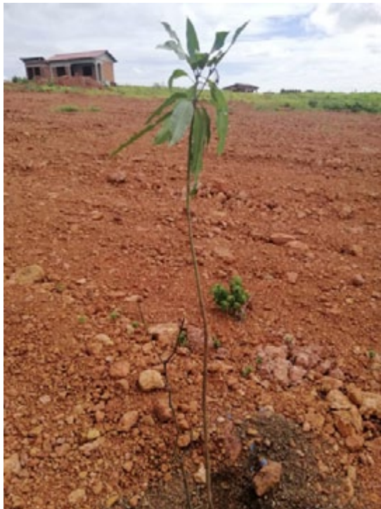
Les arbres plantés par CBG il y a un an sur les terres stériles du site de réinstallation montre peu de signes de production d'ombre dans un avenir proche.

La couche de terre arable est essentielle pour la végétation ; sans elle, le site de réinstallation restera incultivable. CBG déclare avoir planté plus de 3000 arbres et plantes sur le site, avec un taux de réussite de 55%. Cependant, les habitants de Hamdallaye rapportent que les arbres que CBG a plantés il y a un an - s'ils ont survécu - ont montré peu de croissance et ne fournissent aucune ombre pour les abriter de la chaleur intense, contrairement à leur ancien village luxuriant.