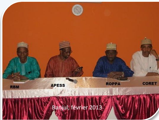
Banjul, février 2013

Face à l'importance et à la complexité des enjeux qu'ils doivent affronter, à la multiplicité des sollicitations auxquelles ils doivent faire face, les réseaux régionaux d'organisations de producteurs - l'Association pour la Promotion de l'Élevage au Sahel et en Savane (APESS), le Réseau des Organisations d'Éleveurs et Pasteurs de l'Afrique (RBM) et le Réseau des Organisations Paysannes et de Producteurs de l'Afrique de l'Ouest (ROPPA)- ont décidé de formaliser leur concertation pour en améliorer l'impact et le bénéfice pour leurs membres.