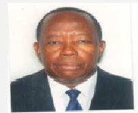
Dr Joël BEASSEM

Le Programme Détaillé pour le Développement de l'Agriculture Africaine (PDDAA) est devenu la référence en matière de stratégies agricoles en Afrique.